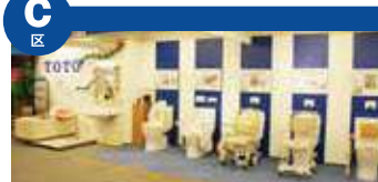
生机勃勃日常中不可缺少的健康。这里展出有，为了健康日常的生活辅助用品和各种护理器关联商品。