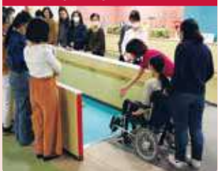
感受电动轮椅的机能和乘坐体验。