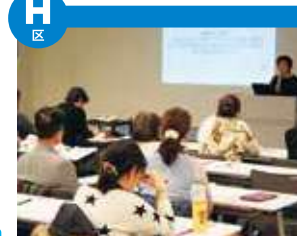
“积极·交流广场”是一处，以护理预防为目的的，为明朗地、愉快的舒畅地歌颂祝福第二人生的积极的老年人开设的交流区。以50岁以上的人群为对象，支持新交流的同时，发布生活、兴趣、健康、工作、参与社会风多种的领域的情报。此外，还经常举办各种各样的活动·研讨会。