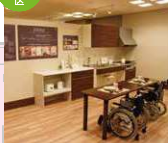
这里是展出无障碍住房的模型区，有如客厅，厨房，卧室等各种场景提案。