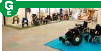
展示各种轮椅，在并设的“轮椅体验区”可以试乘。