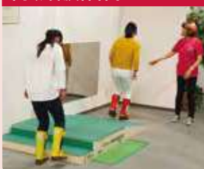
穿着装备，模拟体验高龄者感受。