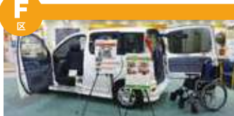
福利车辆，老人车等展出安全地扩展移动范围的移动机器人和关于防灾的展示。