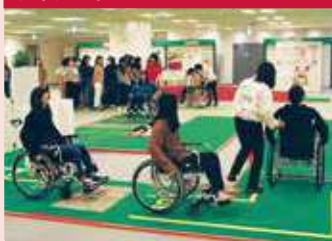
乘坐轮椅，感受有障碍的路面和开关门的体验。