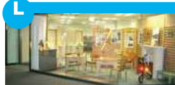
这里是对应高龄社会，为了使生活变得更为舒适的生活用具研究的设计师和企业商家区。