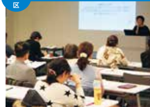
“积极·交流广场”是一处，以护理预防为目的的，为明朗地、愉快的舒畅地歌颂祝福第二人生的积极的老年人开设的交流区。以50岁以上的人群为对象，支持新交流的同时，发布生活、兴趣、健康、工作、参与社会风多种的领域的情报。此外，还经常举办各种各样的活动·研讨会。