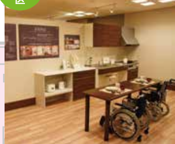
这里是展出无障碍住房的模型区，有客厅，厨房，卧室等各种场景提案。