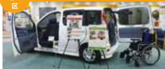
福利车辆，老人车等展出安全地扩展移动范围的移动机器人和关于防灾的展示。