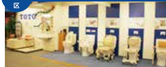
生机勃勃日常中不可缺少的健康。这里展出有，为了健康日常的生活辅助用品和各种护理器关联商品。