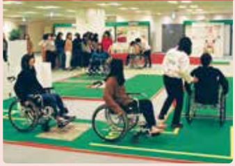
車いすに乗って、障害物のある道やドアの開閉などを体験。