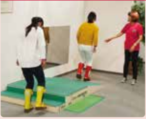
装具をつけて、高齢者になった疑似体験。