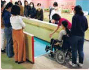
電動車いすの持つ機能や乗り心地を体験。