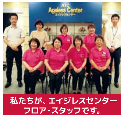
私たちが、エイジレスセンターフロア・スタッフです。

展示場内では、私達フロア・スタッフが出展企業・団体様に代わって、来場のお客様にご案内を致します。