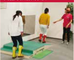
装具をつけて、高齢者になった疑似体験。