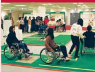
車いすに乗って、障害物のある道やドアの開閉などを体験。