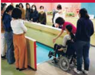
電動車いすの持つ機能や乗り心地を体験。