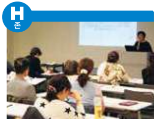
엑티브 / 커뮤니티 광장은 간병이 필요하지 않도록 예방하는 것을 목적으로, 밝고, 즐겁고, 명랑한 제2의 인생을 풍성하게 구가하고 싶어 하는 액티브 시니어를 위한 커뮤니티 공간입니다. 50세 이상인 분들을 대상으로, 새로운 커뮤니티의 형성을 지원함과 동시에 생활, 취미, 건강, 일, 사회 참가 등 다양한 분야의 정보를 제공합니다. 또한, 다양한 이벤트 및 세미나도 다수 개최하고 있습니다.