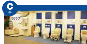
생기 넘치는 생활을 위해 배움을 수 없는 건강, 건강하게 지내기 위한 생활 지원용품 및 다양한 간병기 관련상품을 전시하고 있습니다.