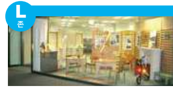
고령 사회에 맞춘 생활하기 편리한 주거 공간과 생활용품의 연구를 하고 있는 디자이너 및 사업가들의 존입니다.