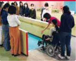
전동 휠체어가 가지고 있는 기능이나 탑승감을 체험