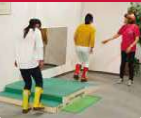
장구를 장착하여 고령자가 된듯한 유사 체험.