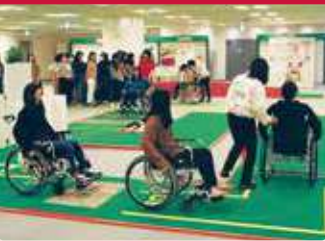
휠체어를 타고 장애물이 있는 길이나 문 여닫기 등을 체험.