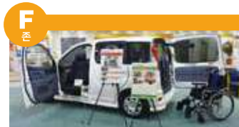
복지 차량, 실버 카 등 안전하게 행동 범위를 넓힐 수 있는 이동기기의 전시와 재난 방지에 관한 전시를 하고 있습니다.