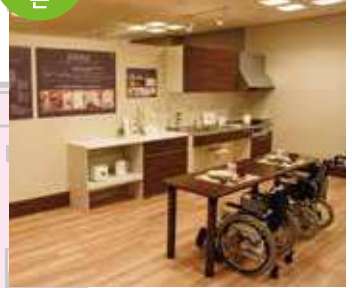
배리어 프리 주택의 모델하우스를 전시하고 있는 존으로 거실, 주방, 침실 등 다방면에서 아이디어를 제안하고 있습니다.