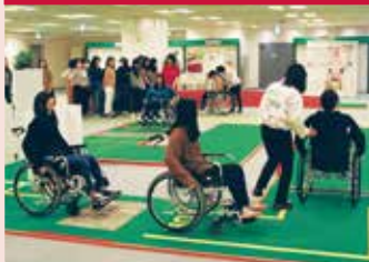
휠체어를 타고 장애물이 있는 길이나 문 여닫기 등을 체험.