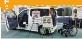
복지 차량, 실버 카 등 안전하게 행동 범위를 넓힐 수 있는 이동기기의 전시와 재난 방지에 관한 전시를 하고 있습니다.