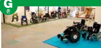
각종 휠체어를 전시하고 있으며, 병실 중인 '휠체어 체험 코스'에서 시승이 가능합니다.