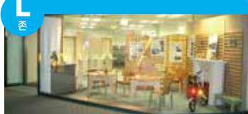
고령 사회에 맞춘 생활하기 편리한 주거 공간과 생활용품의 연구를 하고 있는 디자이너 및 사업가들의 존입니다.