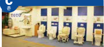
생기 넘치는 생활을 위해 배움을 수 없는 건강, 건강하게 지내기 위한 생활 지원용품 및 다양한 간병기 관련상품을 전시하고 있습니다.