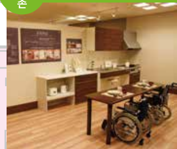
배리어 프리 주택의 모델하우스를 전시하고 있는 존으로 거실, 주방, 침실 등 다방면에서 아이디어를 제안하고 있습니다.