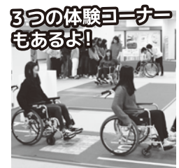
3つの体験コーナー もあるよ!