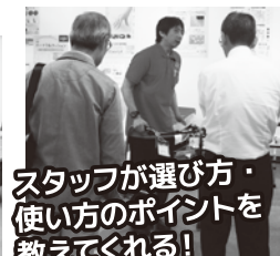
スタッフが選び方・ 使い方のポイントを 教えてくれる!