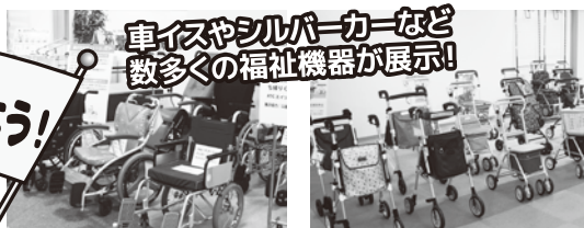
車イスやシルバーカーなど 数多くの福祉機器が展示!