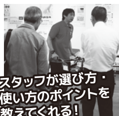
スタッフが選び方・ 使い方のポイントを 教えてくれる!