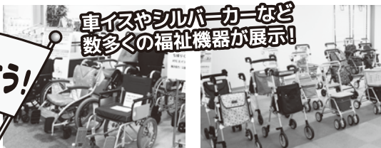
車イスやシルバーカーなど 数多くの福祉機器が展示!

ATC エイジレスセンターは、日本最大規模の健康・福祉・介護関連の常設展示場です。まだまだ元気という人も、介護まったただ中の人も知っておきたいお役立ち情報がたくさん! エイジレスセンターには是非一度お立ち寄りください。