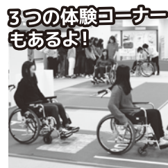
3つの体験コーナー もあるよ!