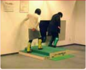
装具をつけて、高年齢者になった疑似体験。