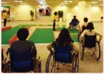
車いすに乗って、障害物のある道やドアの開閉などを体験。