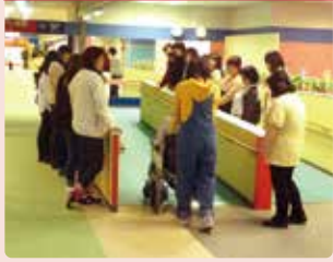
電動車いすの持つ機能や乗り心地を体験。