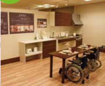
バリアフリー住宅のモデル展示を行っているゾーンで、リビング、キッチン、寝室など、様々なシーンでの提案を行っています。