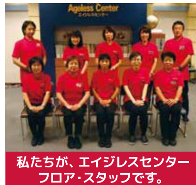
私たちが、エイジレスセンターフロア・スタッフです。

展示場内では、私達フロア・スタッフが出展企業・団体様に代わって、来場のお客様にご案内を致します。