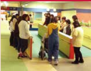
전동 휠체어가 가지고 있는 기능이나 탑승감을 체험