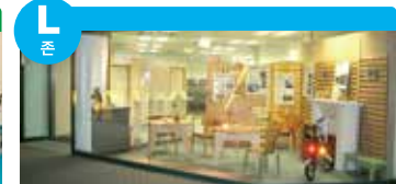
고령 사회에 맞춘 생활하기 편리한 주거 공간과 생활용품의 연구를 하고 있는 디자이너 및 사업가들의 존입니다.