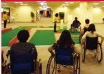
휠체어를 타고 장애물이 있는 길이나 문 여닫기 등을 체험.