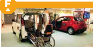
복지 차량, 실버 카 등 안전하게 행동 범위를 넓힐 수 있는 이동기기의 전시와 재난 방지에 관한 전시를 하고 있습니다.