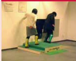
장구를 장착하여 고령자가 된 듯한 유사 체험.