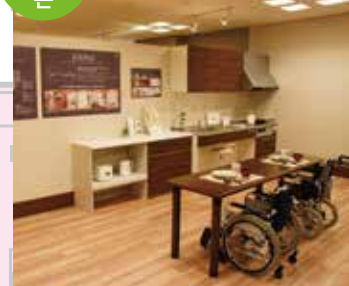
배리어 프리 주택의 모델하우스를 전시하고 있는 존으로 거실, 주방, 침실 등 다양한 면에서 아이디어를 제안하고 있습니다.